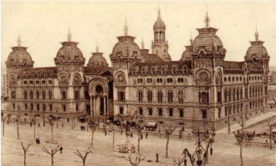
Palau de Justícia en els anys deu del passat segle.

Un fet certament singular i desconegut per al gran públic actual ocorregué durant el període d'instrucció del cas. En el modernista palau de justícia barceloní són cridats a declarar un grup de personatges que no acostumen a passejar-se per allí amb freqüència; són drapaires.